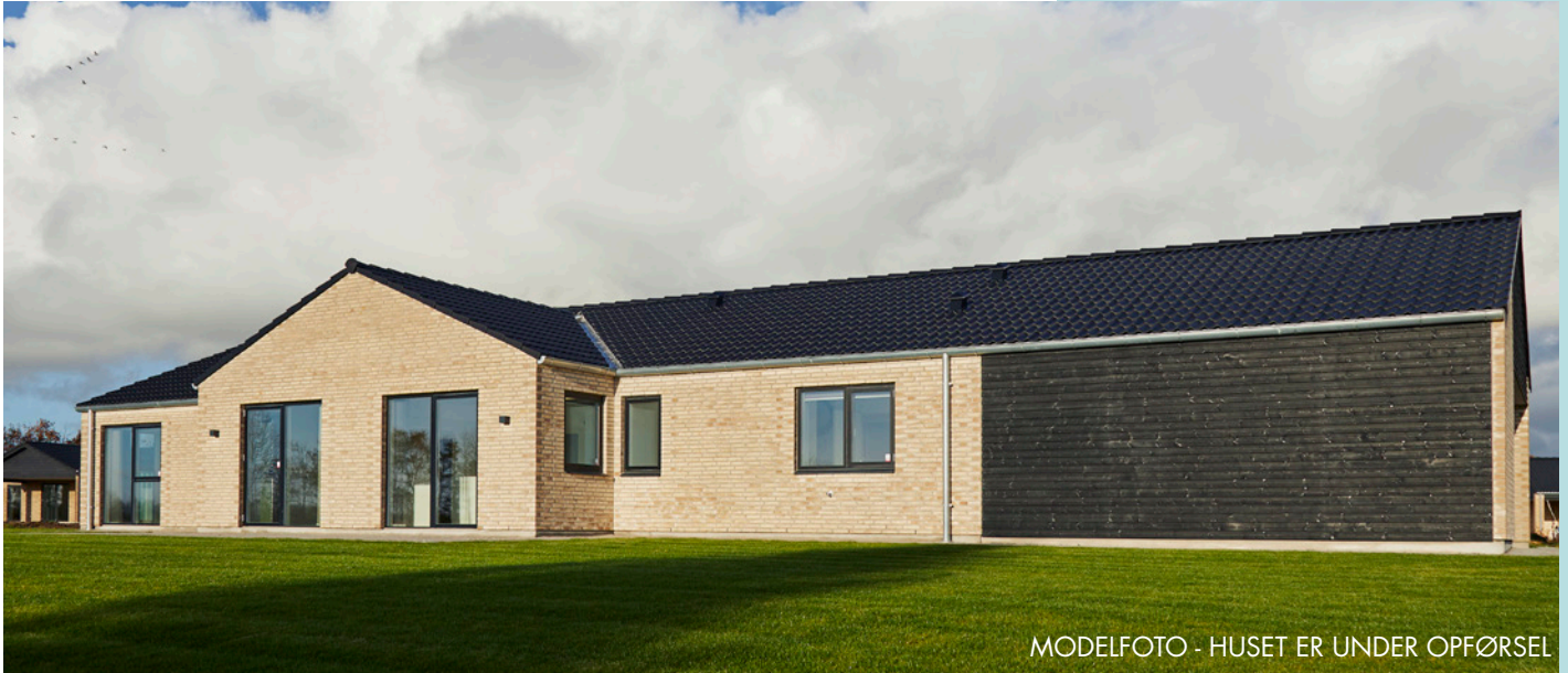
MODELFOTO - HUSET ER UNDER OPFØRSEL

Salgspris, incl. grund 3.495.000,- Betal først ved overtagelse